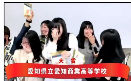
大賞校発表の瞬間