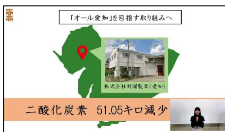
プレゼンテーション資料（一部抜粋）