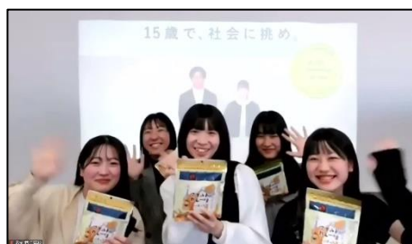
愛知県立愛知商業高等学校の皆さん

※2 環境 (Environment)、社会 (Social)、ガバナンス (Governance) の取り組み